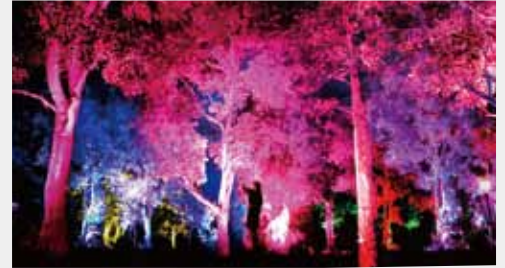
城跡の山の呼応する森／チームラボ