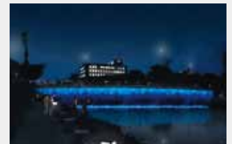
文化を伝承する藍の落水／春日橋 (徳島市LED景観整備事業) Spatial Practice