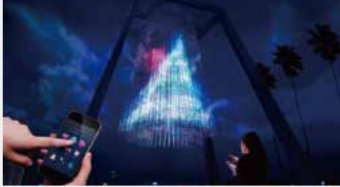
リバーサイドクリスタルツリー／チームラボ