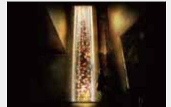
Flowers in the Sandfall-Tokushima (阿波銀行) 阿波銀行×チームラボ