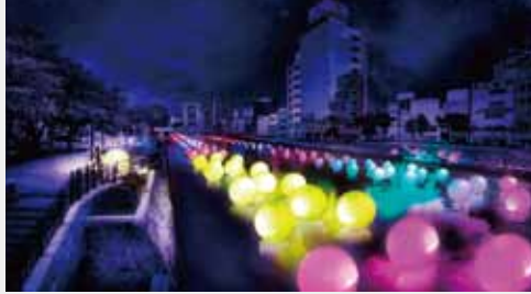
呼応する球体のゆらめく川／チームラボ